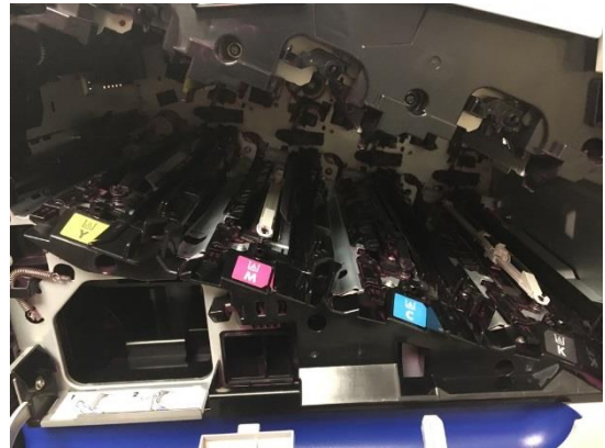
内部全体に飛散したトナー粉末の清掃