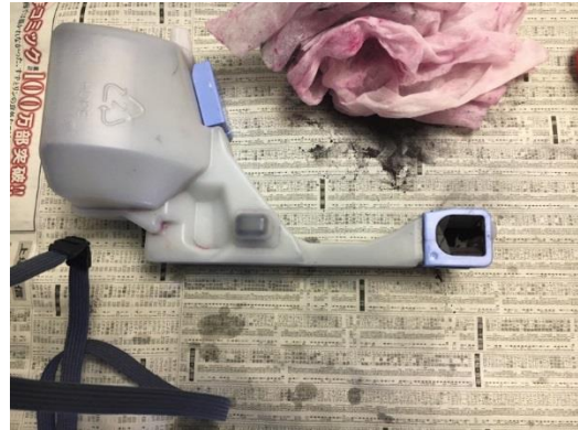
廃トナーボックス回りのトナー漏れを清掃