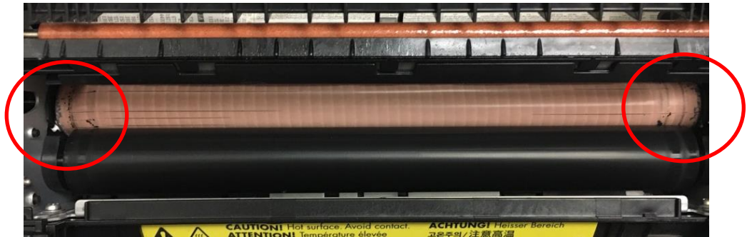
定着器に付着した焦げの拭き取り