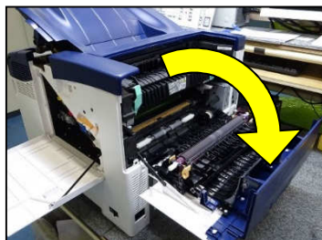
2. 背面カバーと上面カバーを開け、上面カバー部から中間転写ベルトユニットを取り出す。

※取り出した廃トナーBOXは傾けたり振ったりしないで下さい。 廃トナー満杯センサーが汚れ、使用できなくなる恐れがあります。