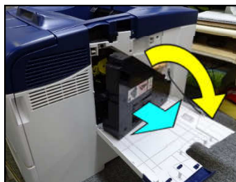
1. プリンターの右側面カバーを開け、廃トナーBOXを取り出す。

プリンター側で画像濃度を正しく検出できない原因として、プリンター内の画像濃度センサー部の汚れや異物付着によりセンサー感度が低下している事が考えられます。このような症状が発生しましたら、以下の手順で画像濃度センサーを清掃して頂きますようお願い致します。